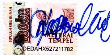
Nazwa Salsabila Azkia

Bandung, 13 Agustus 2025 Yang membuat pernyataan,