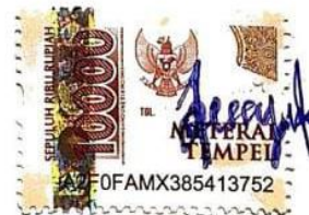
Dessy Salmayanti Putri

Bandung, 14 Juli 2025 Yang membuat pernyataan,